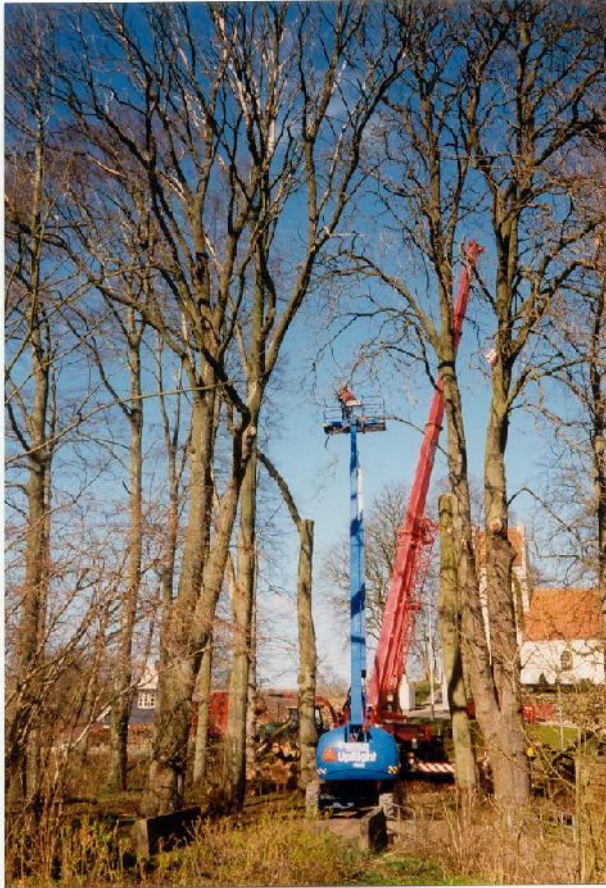
Alléen i Fichstræde fældes februar 2002.