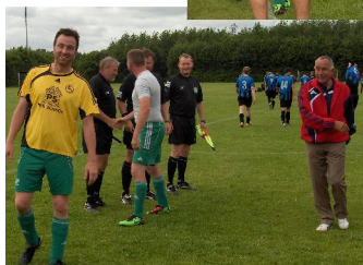
Billeder fra kampene