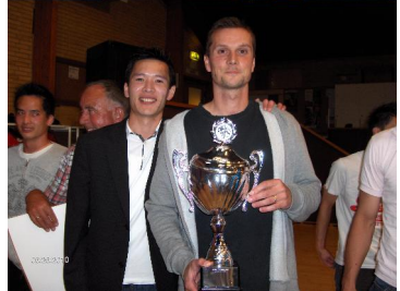
Billeder fra festen

Efter en god sommer starter vi vinterarrangementer i foreningen.