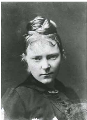
Anne Marie Carl-Nielsen (1863 - 1945)

Undervejs i fortællingen vil der blive vist eksempler på hendes righoldige værk, og der bliver også plads til fællessang.