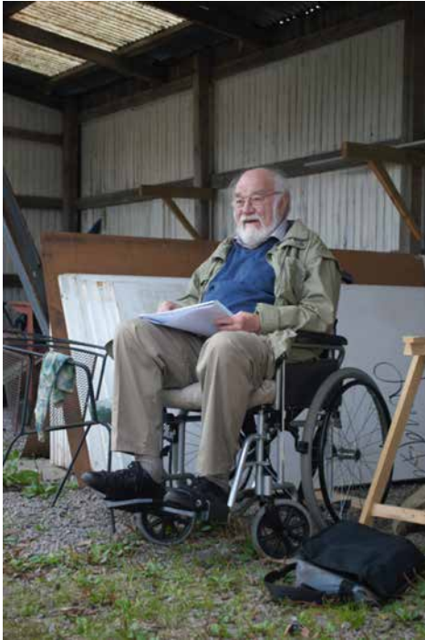
PO har igen gang i skitseblokken

Arbejdslivet startede PO som elektroniklærling, men der var ikke "luft og bevægelse" nok, hvorfor han blev post. Sideløbende arbejdede han med sin kunst, lavede bl.a. vignetter til Fyens Tidende i 40'erne og 50'erne.