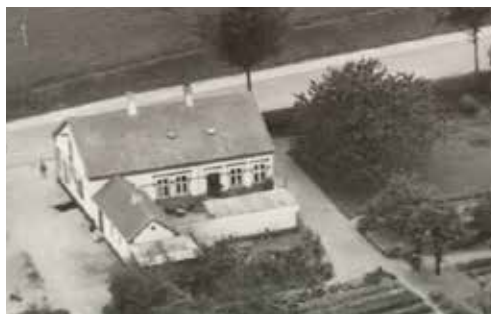
Øverst Åsumvej. Vejen til venstre for huset er den nuværende gangsti langs ådalen