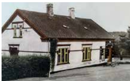
Bemærk gården til højre i billedet