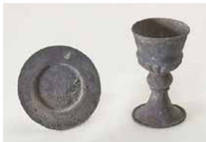
Bispens nadversæt