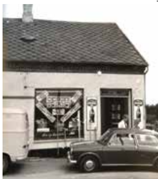
1969 - Ophørsudsalg